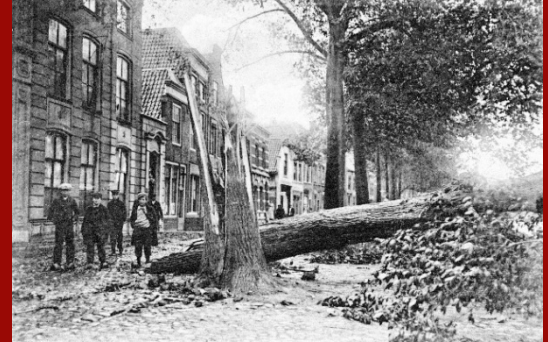
De Oude Haven in 1911, ZA ZG 0083

In de woorden van de gemeente: “De Oude Haven is een uitzonderlijk Rijksmonument en bovendien uniek in Europa: een getijdhaven in een historische binnenstad in combinatie met monumentale gewichtsmuren” . Mooi toch deze stelling. Het onderhoudswerk zal in fasen worden uitgevoerd. Het werk richt zich op het herstel van het bestaande metsel- en voegwerk met behoud van de cultuurhistorische waarde van de kademuur. Onderhoud is de sleutel van behoud.