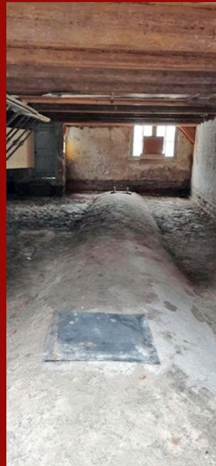
Waterput of cisterne