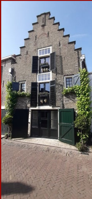
De Swaen voorgevel