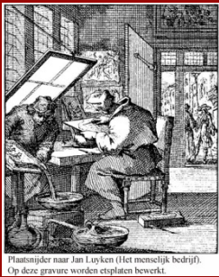
Plaatnijder naar Jan Luyken (Het menselijk bedrijf). Op deze gravure worden etsplaten bewerkt.